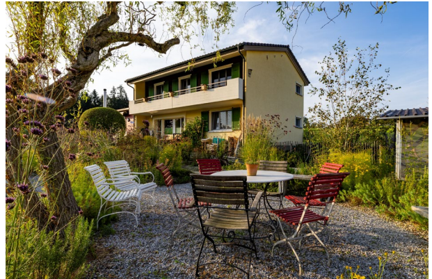
Im Garten des Fluckmättli